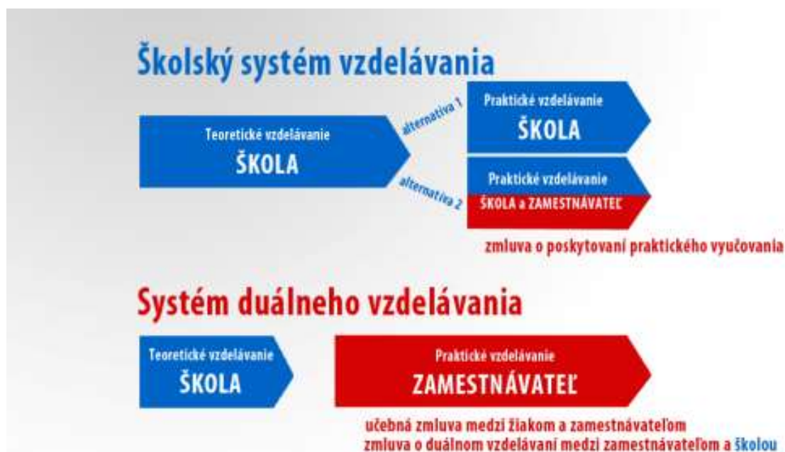
Schéma odborného vzdelávania a prípravy v strednej odbornej škole:

Kto rozhoduje, či sa bude odborné vzdelávanie a príprava žiaka na povolanie uskutočňovať systémom školského vzdelávania alebo systémom duálneho vzdelávania?